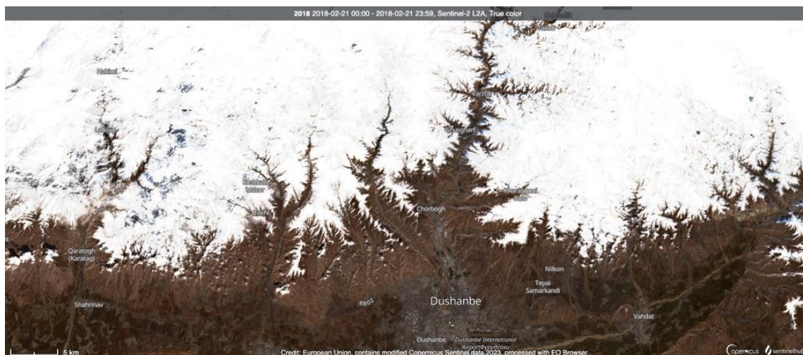
Figura 1 Qui di seguito si possono esaminare le foto dal satellite Sentinel 2 (satellite ESA, facente parte del sistema Copernicus) 17 nella zona di Dushanbe, capitale del Tajikistan. Sopra la città, il ghiacciaio di cui, nel brevissimo excursus di cui si hanno evidenze satellitari specifiche, ossia dal 2018 al 2023, appare di dimensioni ridotte.

I governi di questi paesi hanno recentemente iniziato a porre l'attenzione sul clima e sui suoi effetti e hanno incaricato le Nazioni Unite (con il supporto economico della Federazione Russa) di avviare uno studio per approfondire problemi e soluzioni. Il lavoro da fare è tanto, ma aver posto l'attenzione su questa tematica è già un primo effettivo passo per trovare strategie di adattamento per la popolazione locale.